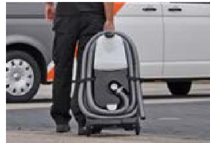
art. 0598001 ROM eSTEAM Rookgenerator