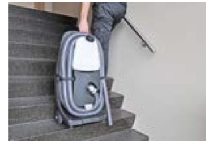
Grote, robuust rubberen wielen rijden gemakkelijk over oneffenheden en tegen trappen op