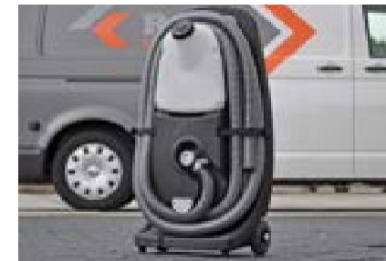
Geen last meer van een loshangende slang