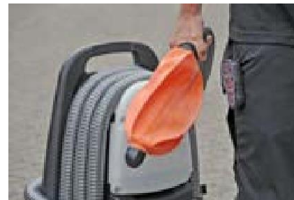
art. 059600 ROM SmokeStopper