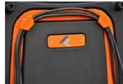
Handige geïntegreerde opbergmogelijkheid voor 230V elektriciteitsnoer (snoerlengte 4 meter)