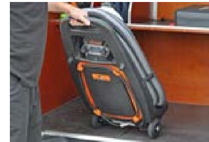
Rubberen wielen zijn ook ideaal om het apparaat ergonomisch en eenvoudig in uw auto te laden