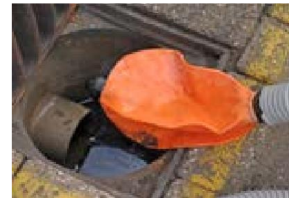
Bevestig de ROM SmokeStopper aan het uiteinde van de rooktoevoerslang