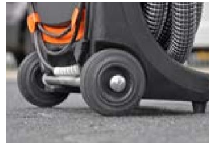
Snel en eenvoudig te transporteren, dankzij rubberen transportwielen