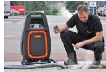
art. 0598002 ROM eSTEAM Rookgenerator, incl. afstandsbediening