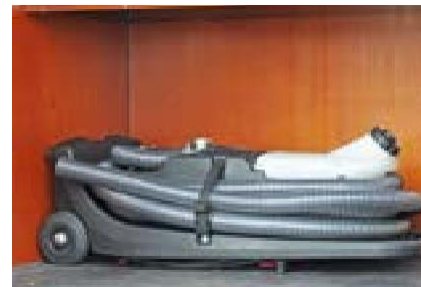
Dankzij rubberen voetjes kunt u de unit ook horizontaal opbergen (zonder te lekken)