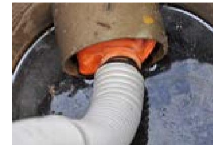
De leiding wordt automatisch luchtdicht afgesloten zodra er rook door de slang gaat